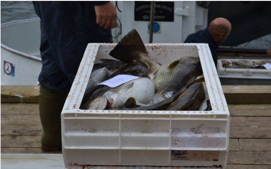
3 kasser torsk andre dag.