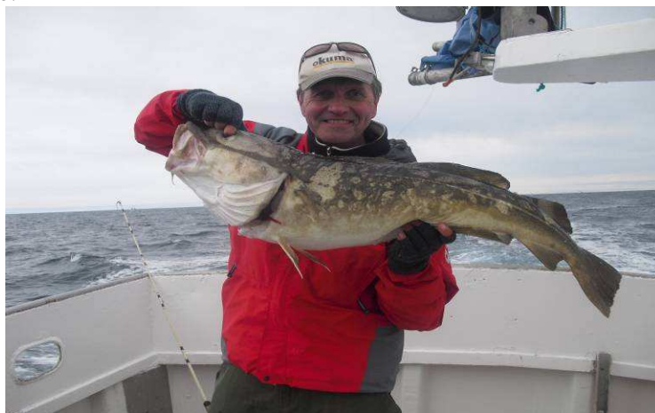
Det begynner å passere 10 kg.