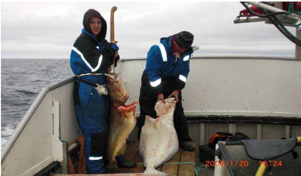
Fin torsk og kveite.