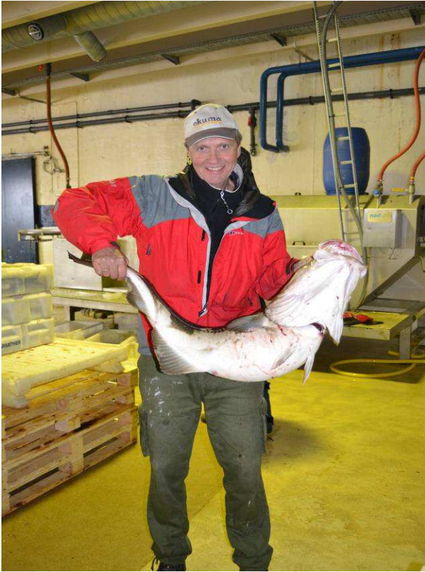
En på drøye 15 kg.