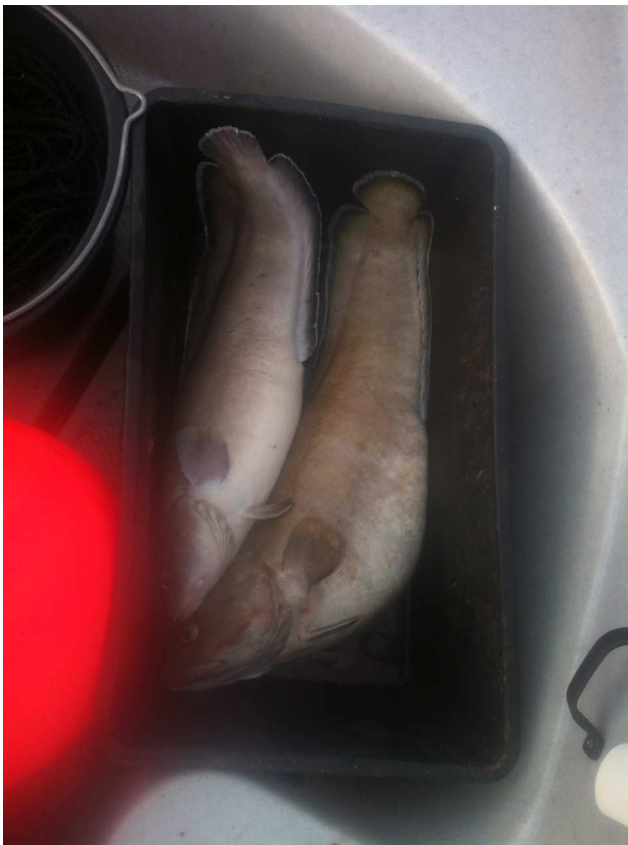
Brosme på 11,66 og 7 kg

Så kom første fisk som var på 11,66 kg om jeg husker riktig , så kom en på 7 kg Flotte fisker. Endelig lønn for strevet og første fisk nå på stang over 10 kg og det blir det boblebad, sigar og Cognac av