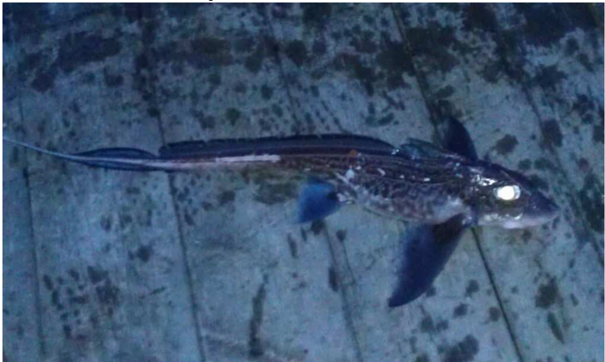
Havmus – Norges giftigste fisk

Så skulle han skremme meg med dette bilde for så siden si at det var noen venner som hadde satt line i Garsundet. Kult å se at den er her og.