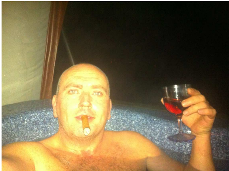
10+ Sigaren

Så skulle han skremme meg med dette bilde for så siden si at det var noen venner som hadde satt line i Garsundet. Kult å se at den er her og.